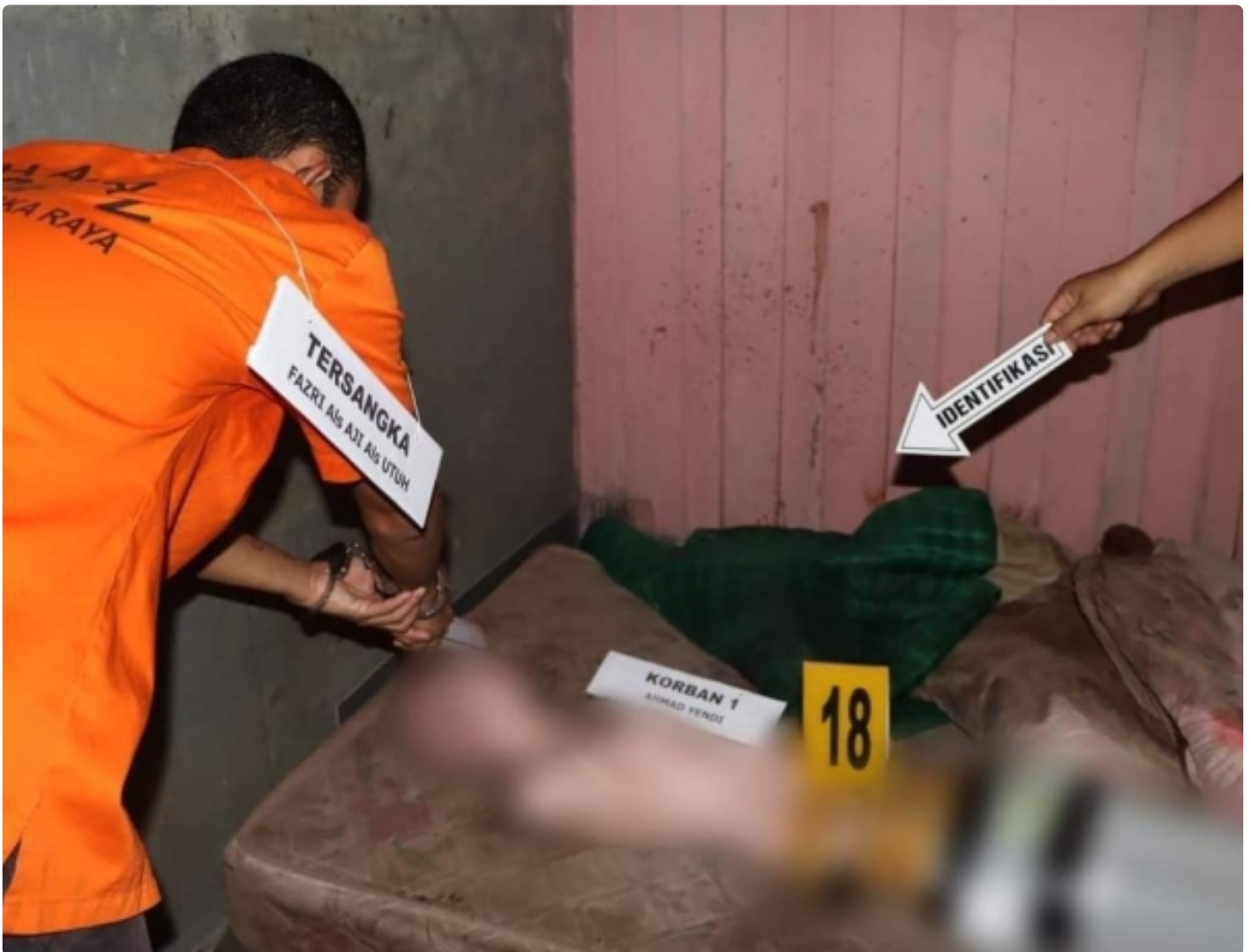
Tersangka F (26) Saat Melaksanakan Rekontruksi

PALANGKA RAYA - Proses penyidikan masih terus dilakukan oleh Satuan Reserse Kriminal (Satreskrim) Polresta Palangka Raya, Polda Kalteng terhadap kasus pembunuhan pasangan suami istri (pasutri) yang terjadi di wilayah hukumnya.