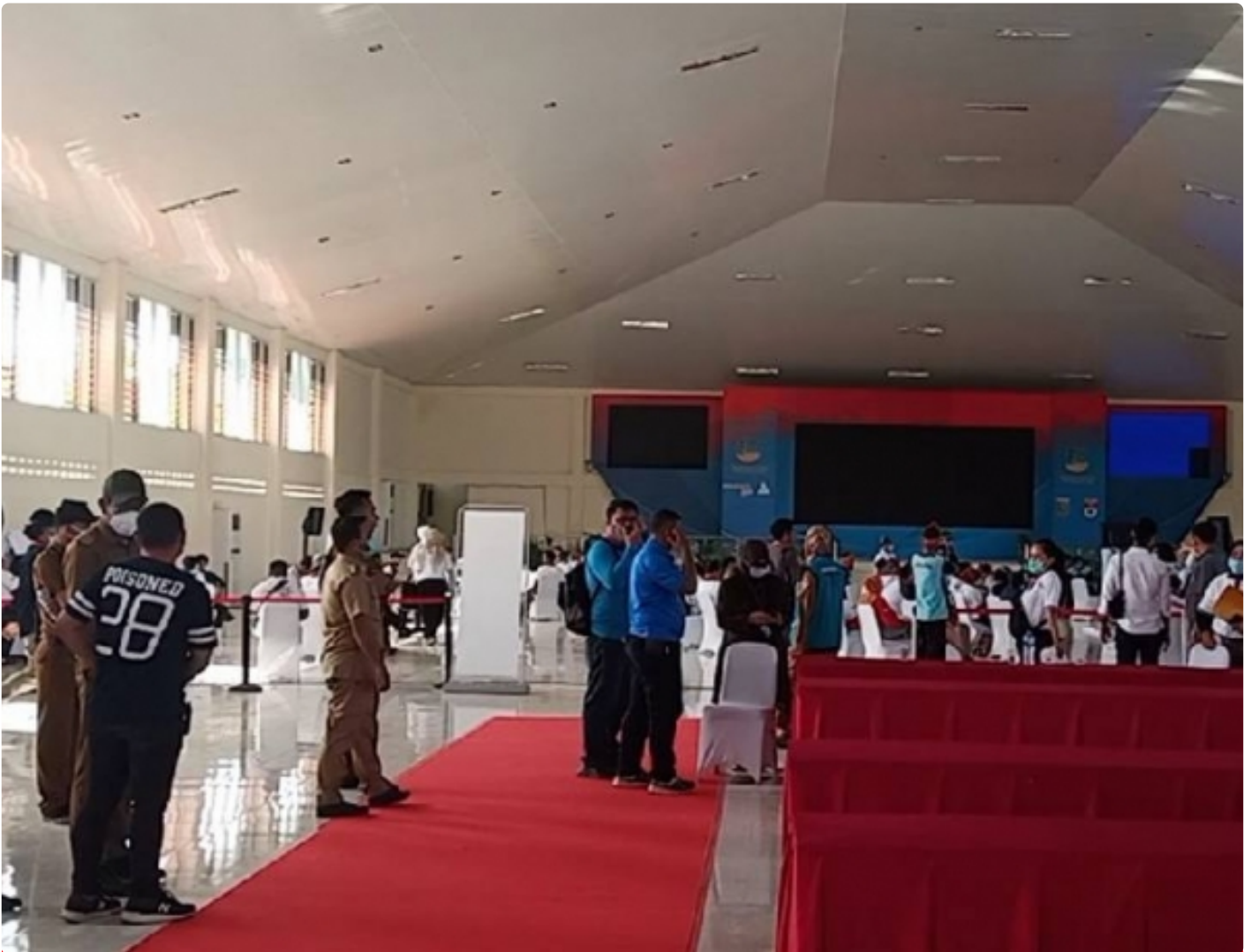
Panitia Penyelenggara dari bagian Kementerian sosial, pusat, provinsi dan daerah

MESUJI-Persiapan panitia penyelenggara, sambut Menteri sosial Republik Indonesia dalam rangka launching dan pengukuhan pengurus Pelopor Perdamaian Indonesia (Prodam) yang dilaksanakan Selasa (01/12) besok, bertempat di Taman Keanekaragaman Hayati, Mekar Jaya, Kecamatan Tanjung