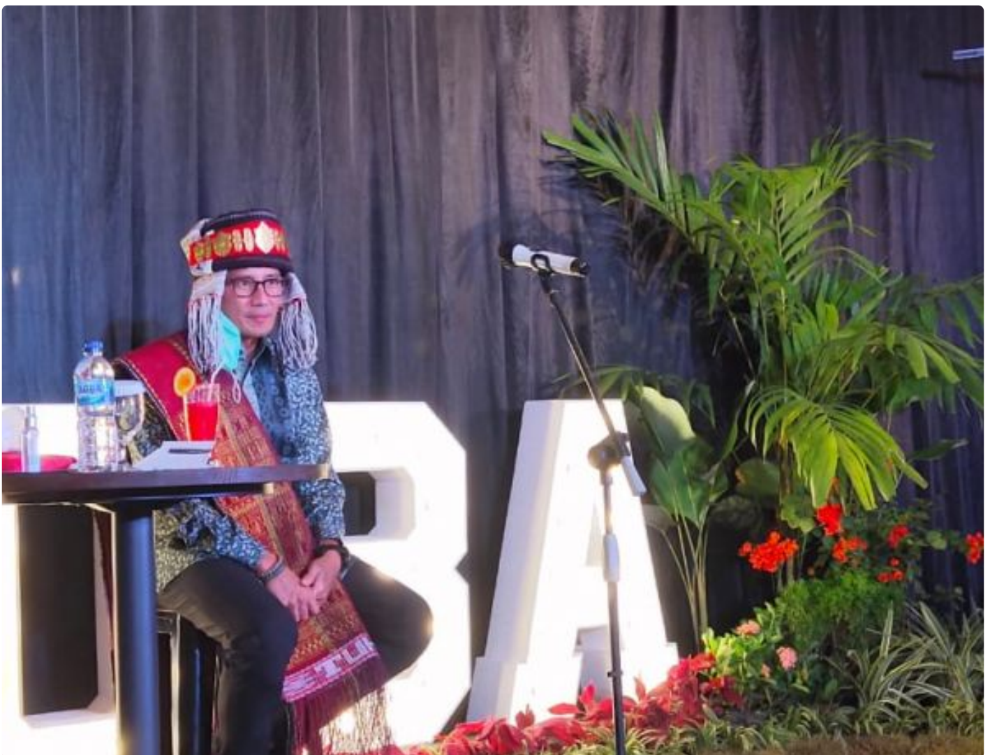
Sandiaga Salahuddin Uno, Menteri Pariwisata dan Ekonomi Kreatif

SIMALUNGUN - Menteri Pariwisata dan Ekonomi Kreatif menggelar pertemuan terbatas dan langsung berdialog dengan sejumlah pelaku usaha Pariwisata dan Ekonomi Kreatif yang berada di Kawasan Danau Toba, di Ballroom Niagara Hotel