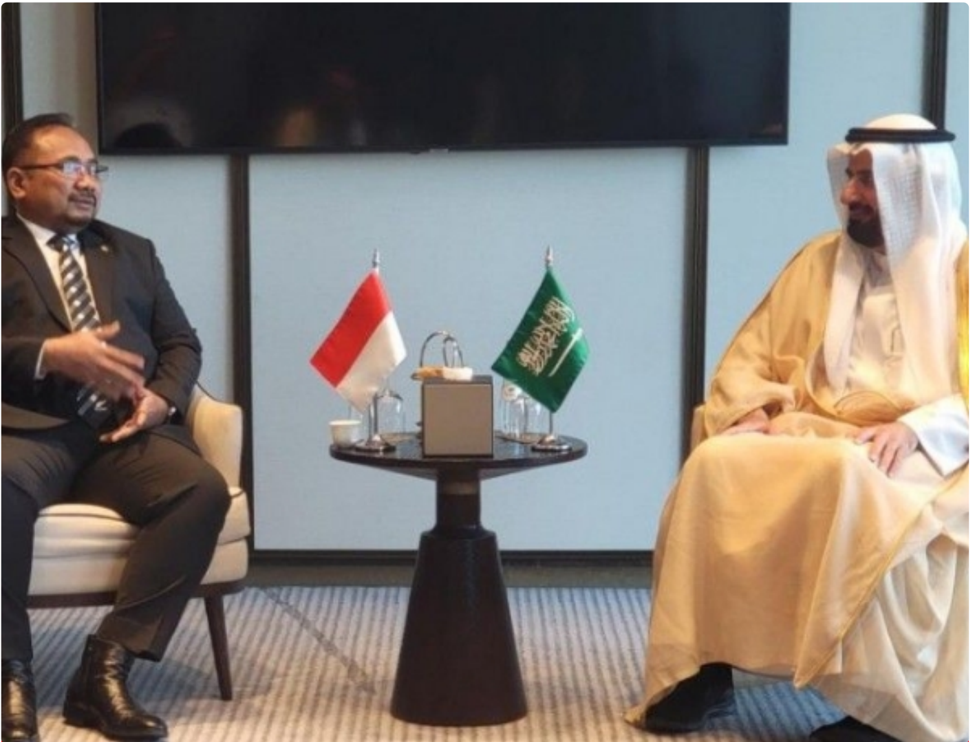
Menag Yaqut bertemu Menteri Haji Arab Saudi Tawfiq F. Al Rabiah, di Jeddah.

JAKARTA - Indonesia dan Pemerintah Kerajaan Arab Saudi telah menandatangani kesepakatan penyelenggaraan ibadah haji 1444 H/2023 M. Kesepakatan tersebut ditandatangani hari ini oleh Menag Yaqut Cholil Qoumas bersama Menteri Haji dan Umrah Arab Saudi Tawfiq F Al Rabiah di Jeddah.