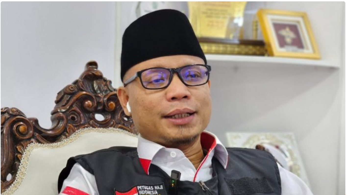
Ketua PPIH Arab Saudi

JEDDAH - Kementerian Agama menyiapkan asuransi jiwa bagi jemaah haji Indonesia yang wafat. Disiapkan juga asuransi bagi jemaah haji yang mengalami kecelakaan.