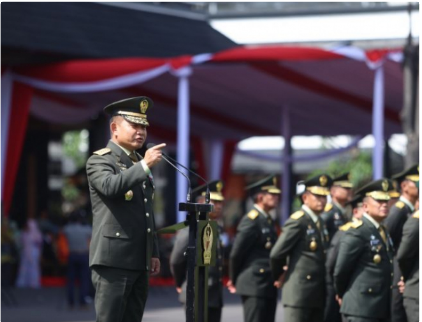
Kepala Staf Angkatan Darat (Kasad) Jenderal TNI Dr. Dudung Abdurachman saat menyampaikan pesan kepada 292 Perwira Remaja (Paja) TNI AD Lulusan Akademi Militer Tahun 2022 di Mabesad, Jakarta

Jakarta – "Ingat Prajurit kita saat ini bukanlah obyek lagi, tetapi telah menjadi subyek. Kalau kamu memimpin tidak benar maka dia akan bergejolak dan kamu akan berhenti. Oleh karena itu lakukan yang terbaik dengan berpegang teguh kepada Sapta Marga, Sumpah Prajurit dan 8 Wajib TNI serta 11 azas