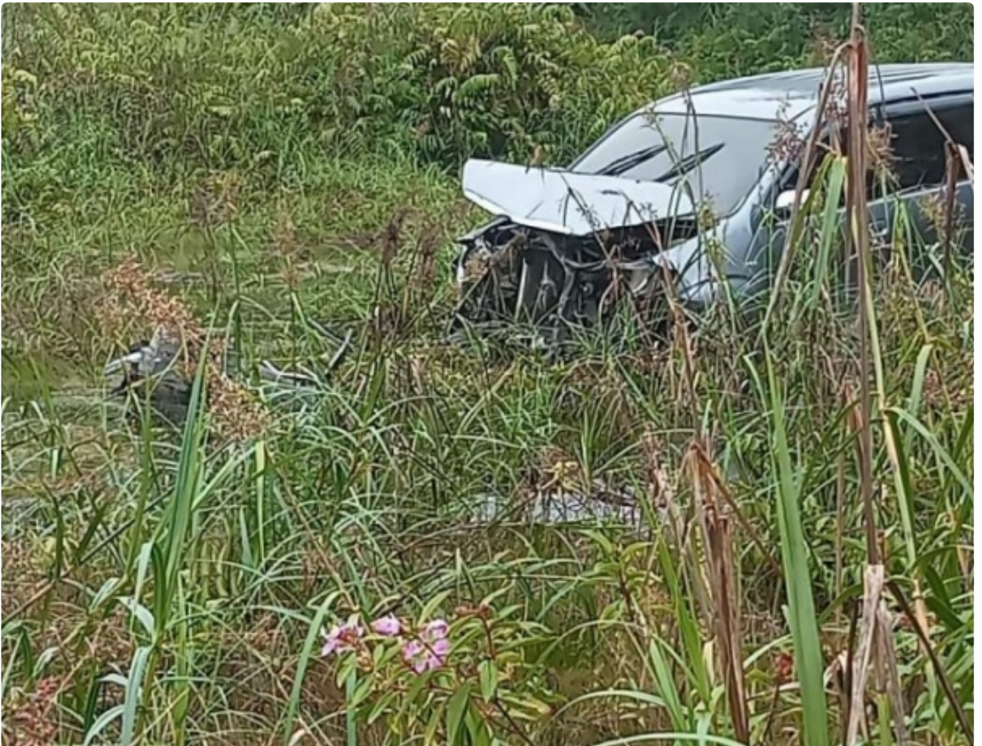
Kondisi Mobil Mini Bus Avanza di Rawa Jalan Mahir Mahar Lingkar Luar Palangka Raya

PALANGKA RAYA - Ada - ada saja yang dialami sopir mini bus Avanza ini tadi malam, Jumat (25/11). Mobil yang dikemudikan yang belum diketahui namanya kecelakaan tunggal arah jalan Mahir Mahar, Kota Palangka Raya, Kalimantan Tengah.