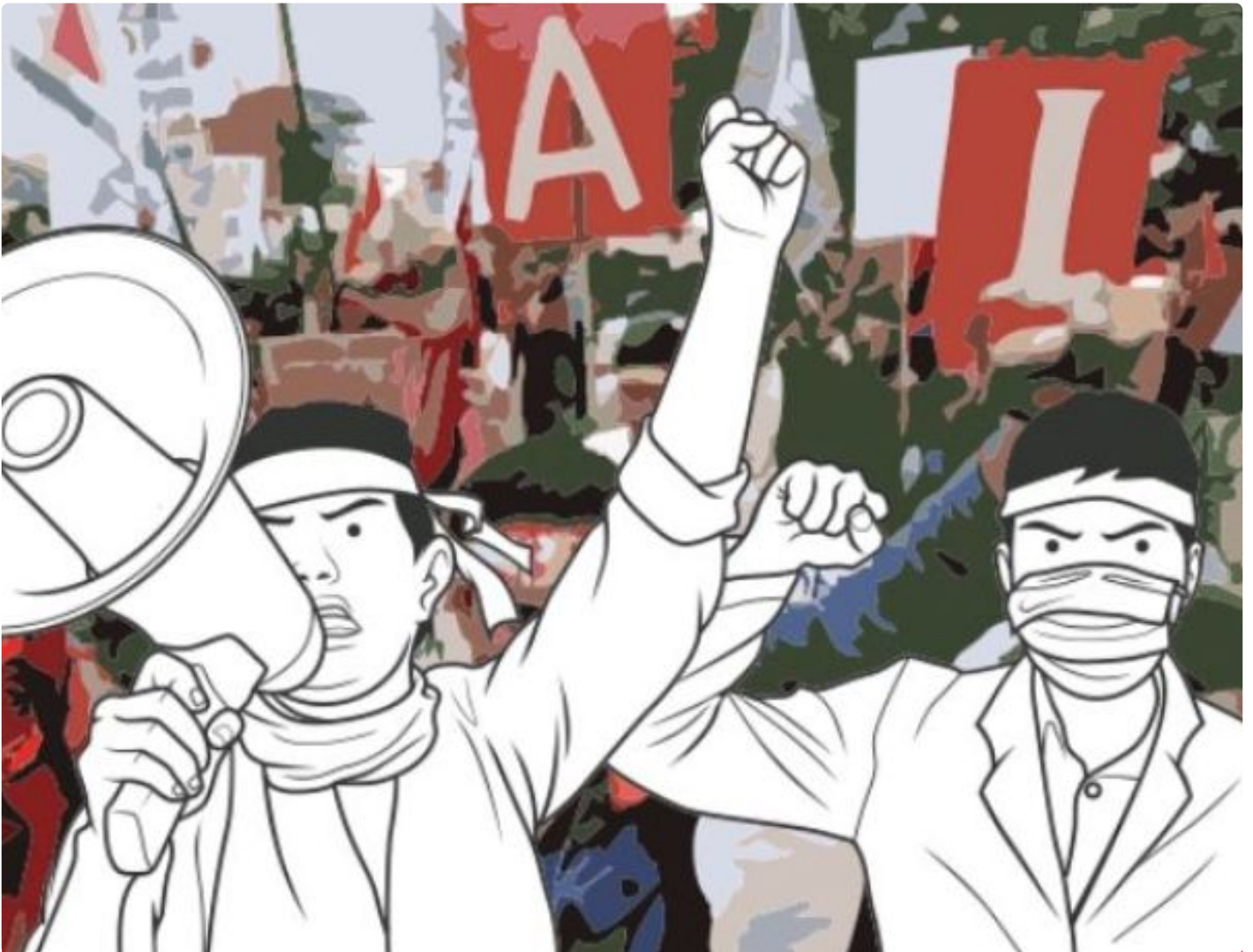
Ilustrasi Gambar Demo Masyarakat

PALANGKA RAYA - Paska divonis bebasnya bandar besar Narkoba, Salihin Bin Abdulah alias Saleh beberapa waktu oleh Majelis Hakim Negeri Pengadilan (PN) Palangka Raya, menuai kontroversi dan kecamatan masyarakat, khusus kota Palangka Raya.