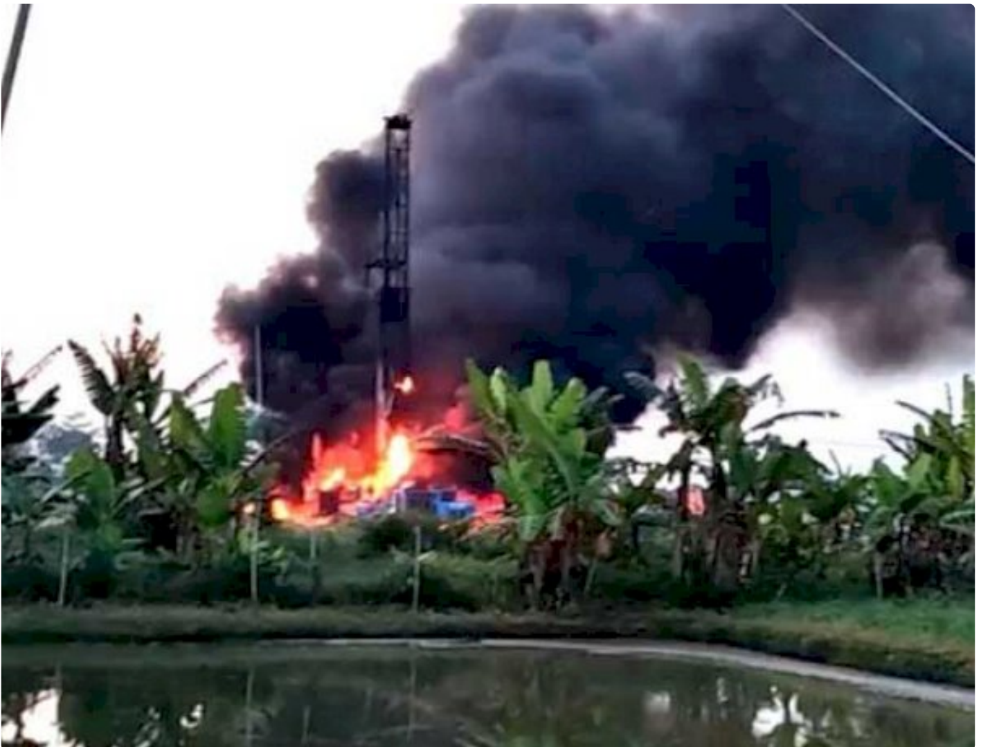
Api membubung tinggi di lokasi sumur produksi Pertamina EP di Desa Lopak Alai, Muarojambi

MUARO JAMBI - Sebuah sumur produksi PT Pertamina EP di wilayah di Desa Lopak Alai, Kecamatan Kumpeh Ulu, Kabupaten Muarojambi, Provinsi Jambi, terbakar menjelang magrib, Rabu (14/10).